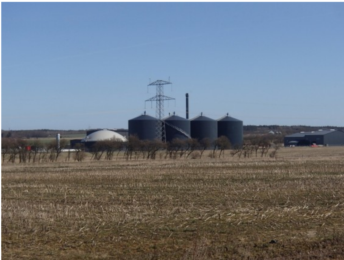
Biogasanlægget ved Holsted (taget fra indkørslen til Danish Crown). Bygningen yderst til højre huser NC Miljøs affaldbehandlingsanlæg.

herhjemme vil kunne ændre brancheaftalen.